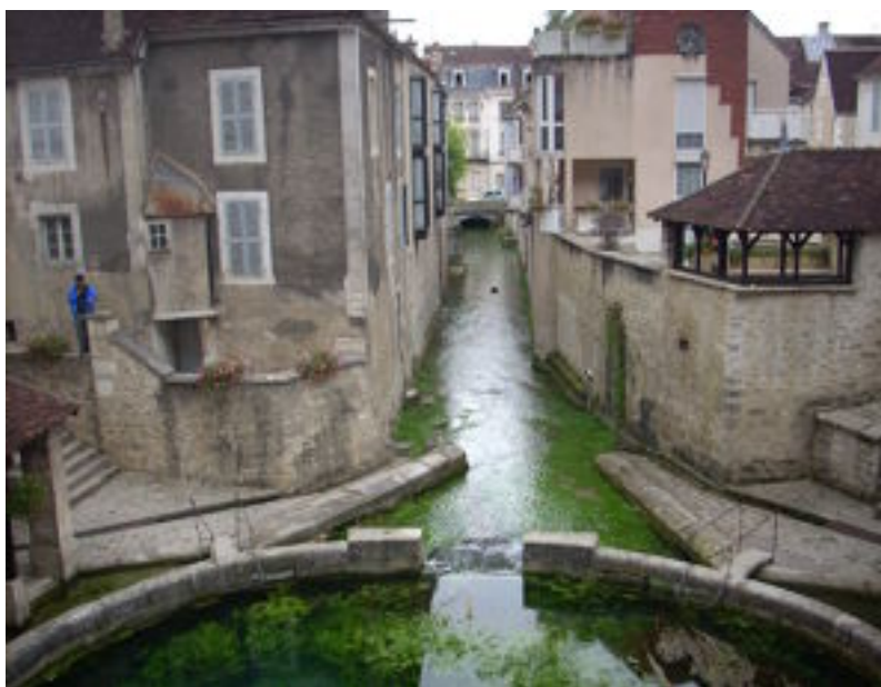
Opname uit de serie over de vaartocht door Frankrijk

De laatste serie voor de pauze gaf ons een beeld van enkele meren die zout water bevatten. In deze serie waarin ook een stukje video was opgenomen kwamen we o.a. in de steden Montpellier en Avignon. Hierbij werden de verdedigingswerken (ommuring of omwalling) goed uitgebeeld. Ook het bekende liedje “Sur le pont d'Avignon” speelde een rol. Ondersteunende muziek was van Laurens van Rooyen. Een van de clubleden meende dat dit de beste serie was van de drie die we gezien hadden. Er was ook een ander lettertype gebruikt wat de leesbaarheid ten goede kwam.